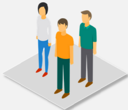
beneficiari del Reddito di Cittadinanza

Politica attiva del Lavoro che aiuta a rimettere in moto la persona oltre che far acquisire nuove competenze (Leva Motivazionale)