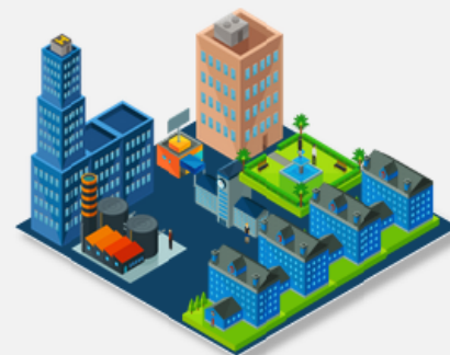
Comune di residenza

DISPONIBILITÀ DEI BENEFICIARI DEL REDDITO DI CITTADINANZA